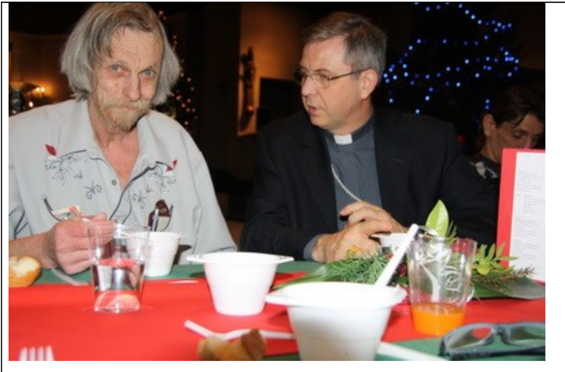
Samen tafelen met Bisschop Johan Bonny